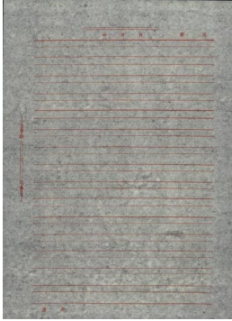
Afbeelding zonder accessoire voor witte achtergronden

U kunt dit accessoire bestellen onder cat.nr. 829 3599.