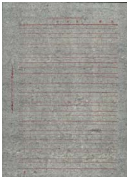
Ergebnis ohne Zubehörteil