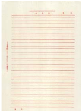
Ergebnis mit Zubehörteil

Das Zubehörteil für weißen Hintergrund enthält zwei weiße Hintergrundstreifen, die gegen die schwarzen Hintergrundstreifen im Scanner ausgetauscht werden. Bewahren Sie die schwarzen Hintergrundstreifen auf - Sie müssen sie zum Kalibrieren des Scanners wieder einsetzen.