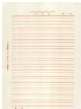
Image produite avec fond blanc

L'accessoire comporte deux bandes de fond blanc permettant de remplacer les bandes de fond noir du scanner. Ne jetez pas les bandes de fond noir car il vous faudra les remettre en place dans le scanner pour effectuer l'étalonnage.