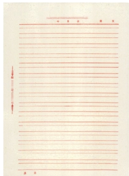
安装白色背景附件时的图像